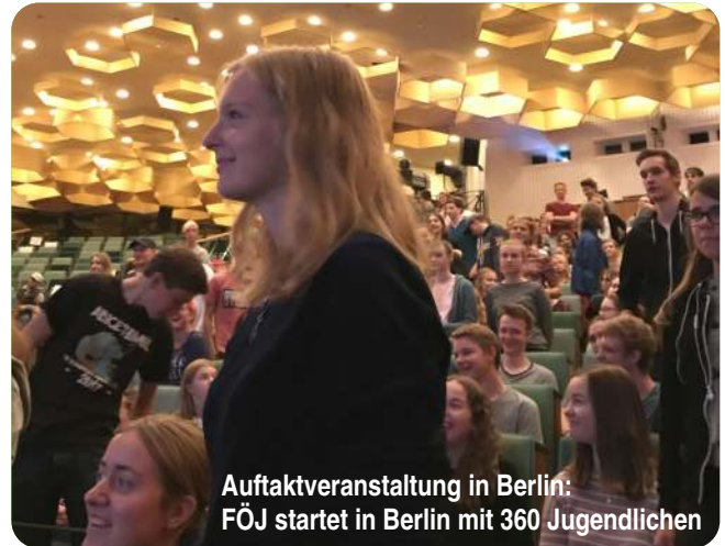
Auftaktveranstaltung in Berlin: FÖJ startet in Berlin mit 360 Jugendlichen

Alle Freiwilligen erhalten ein monatliches Taschengeld, sind voll sozialversichert, haben Urlaubsanspruch, werden in Seminaren geschult und von Einsatzstellen individuell betreut. FSJ, FÖJ, BFD und ÖBFD – die Bezeichnungen sind kurz, ihre Bedeutungen oft nicht klar. Die einen machen was mit Menschen, die anderen mit Blumen. – So das Klischee. Ganz so einfach ist es jedoch nicht. Um alle Missverständnisse auszuräumen, die vier Projekte im Überblick.